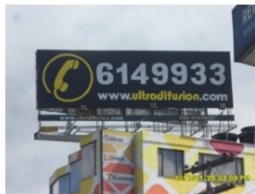
SENTIDO OESTE- ESTE DE LA VALLA TUBULAR