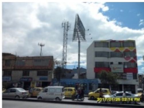
FACHADA DEL INMUEBLE Avenida Calle 145 No. 98B – 45